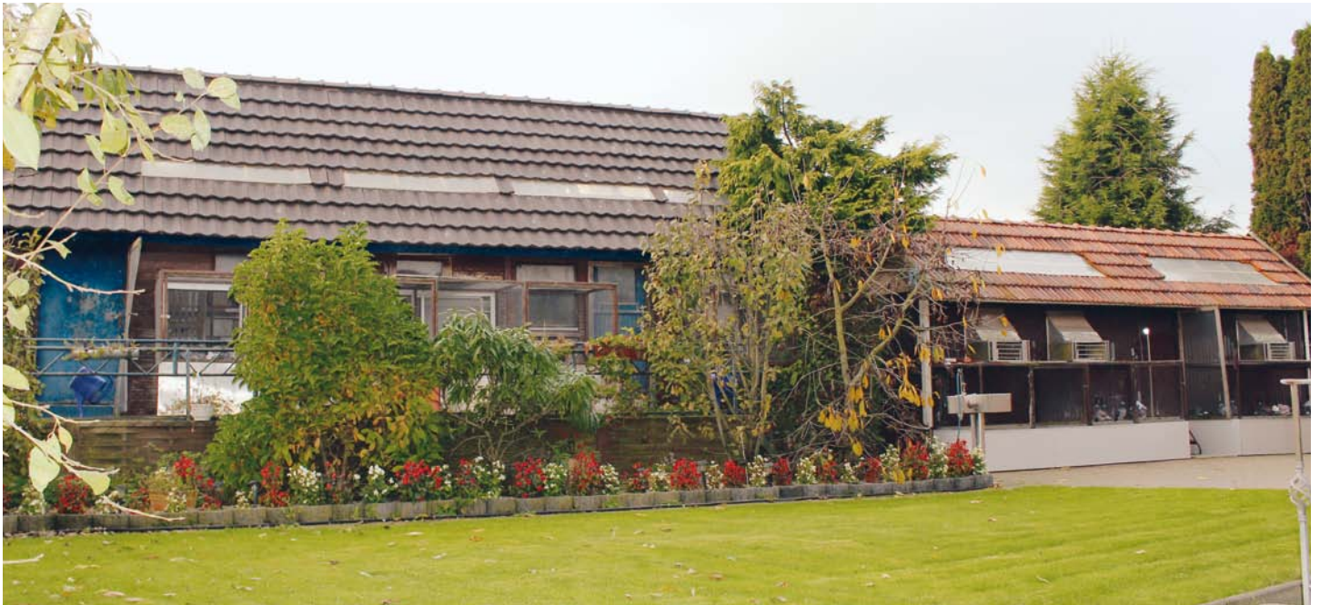
Hier eine Übersicht der Reiseschläge der SG Pumpe & Posser in Hamminkeln-Mehrhoog.

Die Stunde der Wahrheit schlägt bei den Zweijährigen, hier sollen sie sich mindestens zweimal bis 1000 km erfolgreich durchgesetzt haben. Dreijährig stehen sie voll im Saft, um bei Pau, Barcelona und Co., keiner unter 1000 km, viel versprechend mithalten zu können.